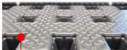
TwinSheet Palette geschweißt